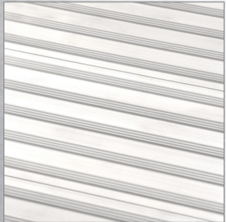
Plate-forme large avec motif antidérapant de 60 x 61 cm.